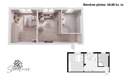
Bendras plotas: 48.88 kv. m.