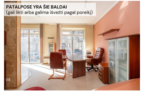
PATALPOSE YRA ŠIE BALDAI (gali likti arba galima išvežti pagal poreikį)