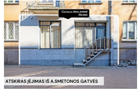
ATSKIRAS JĖJIMAS IŠ A.SMETONOS GATVĖS