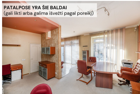
PATALPOSE YRA ŠIE BALDAI (gali likti arba galima išvežti pagal poreikį)