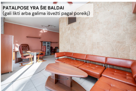
PATALPOSE YRA ŠIE BALDAI (gali likti arba galima išvežti pagal poreikį)