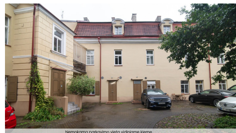
Nemokama parkavimo vieta vidiniame kieme