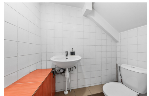
Pateikimas į cokolinį aukštą