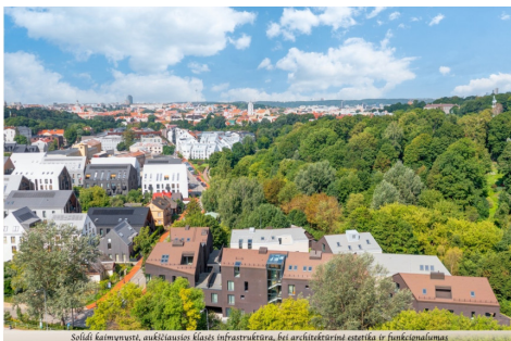
Solīdi kaimiņbūvniecība, augstākā līmeņa infrastruktūra, bet arhitektoniskā estētika ir funkcionāluma