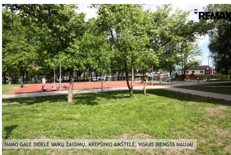
NAMO GALĖ DIDELĖ VAIKŲ ŽAIDIMŲ, KREPŠINIO AIKŠTELĖ, VISKAS ĮRENGTA NAUJAI