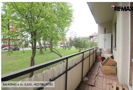
BALKONAS 6 m. ILGIO, NEJSTIKLINTAS