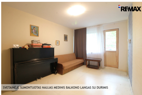
SVETAINĖJE SUMONTUOTAS NAUJAS MEDINIS BALKONO LANGAS SU DURIMIS