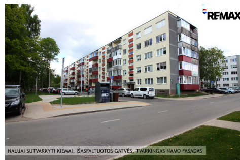
NAUJAI SUTVARKYTI KIEMAI, IŠASFALTUOTOS GATVĖS, TVARKINGAS NAMO FASADAS