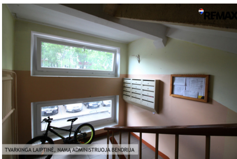
TVARKINGA LAIPTINĖ, NAMĄ ADMINISTRUOJA BENDRIJA