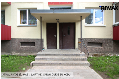
ATNAUJINTAS ĖJIMAS | LAIPTINĖ, ŠARVO DURYS SU KODU