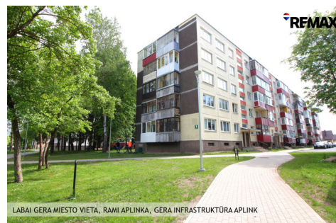
LABAI GERA MIESTO VIETA, RAMI APLINKA, GERA INFRASTRUKTŪRA APLINK