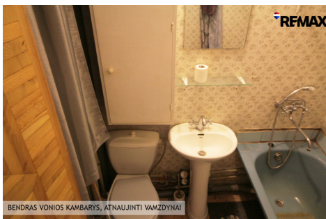
BENDRAS VONIOS KAMBARYS, ATNAUJINTI VAMZDYNIAI