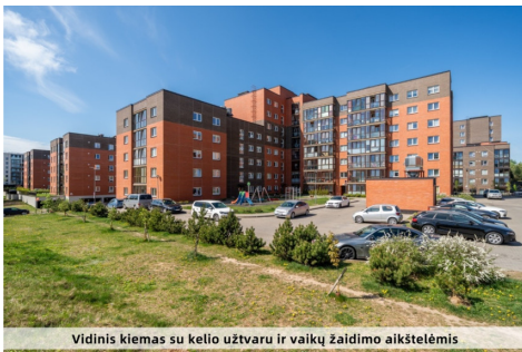
Vidinis kiemas su kelio užtvaru ir vaikų žaidimo aikštelėmis