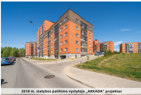
2018 m. statybos patikimo vystytojo „ARKADA“ projektas