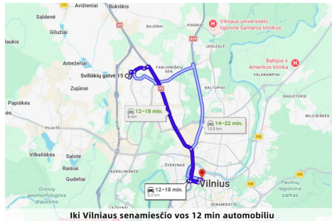
Iki Vilniaus senamiesčio vos 12 min automobiliu