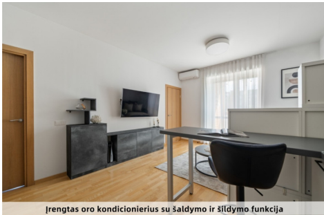
Įrengtas oro kondicionierius su šaldymo ir šildymo funkcija