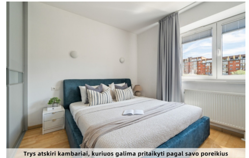
Trys atskiri kambariai, kuriuos galima pritaikyti pagal savo poreikius