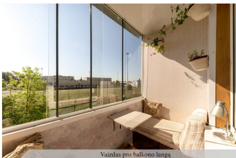
Vaizdas pro balkono langą