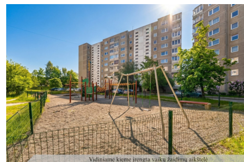
Vidiniame kieme įrengta vaikų žaidimų aikštelė