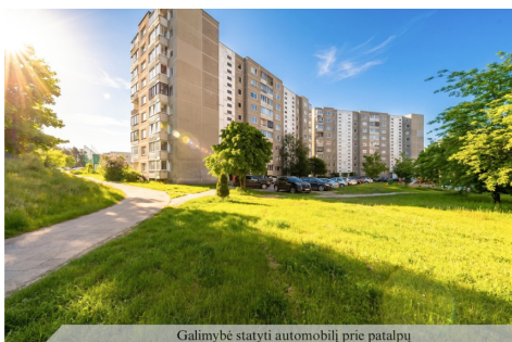
Galimybė statyti automobilį prie patalpų