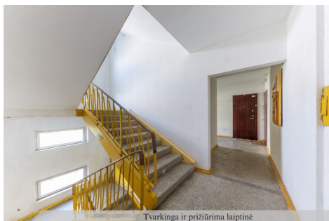
Tvarkinga ir prižiūrima laiptinė