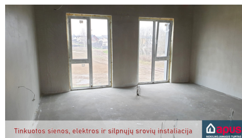
Tinkuotos sienos, elektros ir šilpnųjų srovių instaliacija