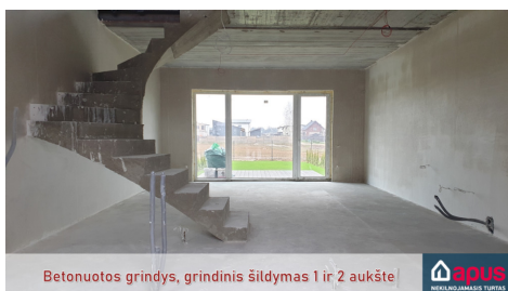
Betonuotos grindys, grindinis šildymas 1 ir 2 aukšte