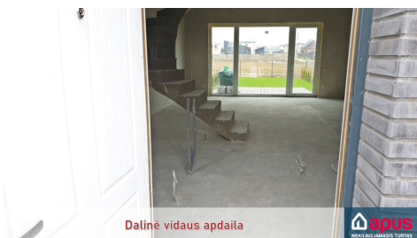
Dalinė vidaus apdaila