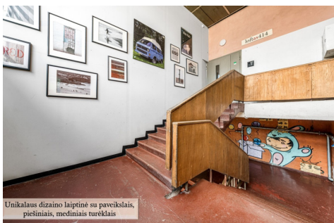
Unikalūs dizaino laiptinė su paveiklais, piešiniais, mediniais turėklais