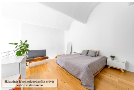
Skiautinės lubos, priduodančios erdvės pojūtį ir klasikumą