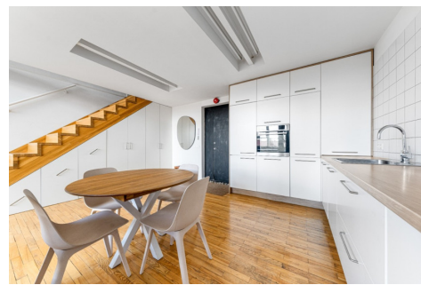
Baltos sienos derinamos su tikro medžio masyvo laiptais bei natūraliu parketu