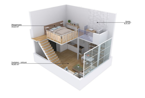
Miegamoji 12,22 m 2 Vonia 4,71 m 2 Sveikama - virtuvė 40,85 m 2