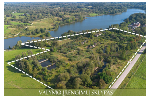
VALYMO ĮRENGIMŲ SKLYPAS