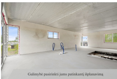
Galimybė pasirinkti jums patinkantį išplanavimą