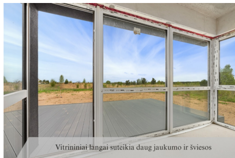
Vitriniai langai suteikia daug jaukumo ir šviesos