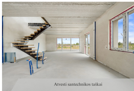
Atvesti santehnikos taškai