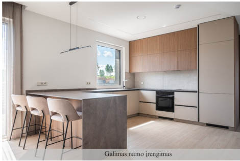
Galimas namo įrengimas