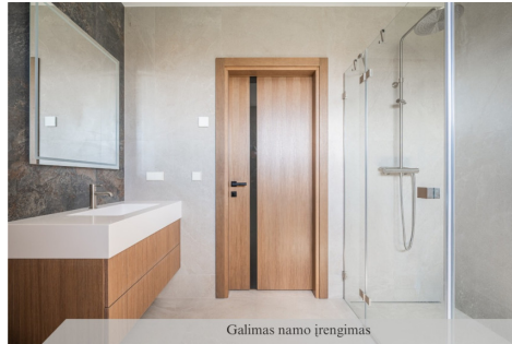
Galimas namo įrengimas