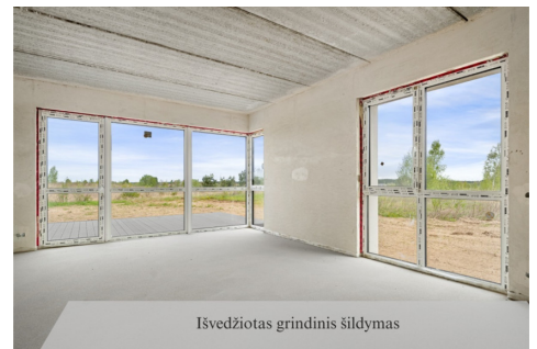
Išvedžiotas grindinis šildymas