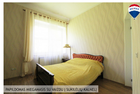
PAPILDOMAS MIEGAMASIS SU VAIZDU | SUKILĖLIŲ KALNELIŲ