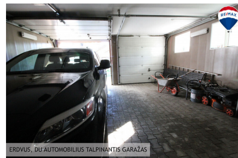
ERDVUS, DŪ AUTOMOBILIUS TALPINANTIS GARAŽAS