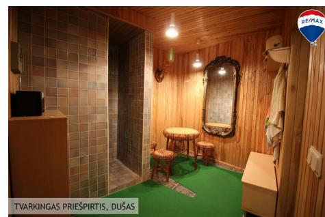
TVARKINGAS PRIEŠPIRTIS, DUŠAS