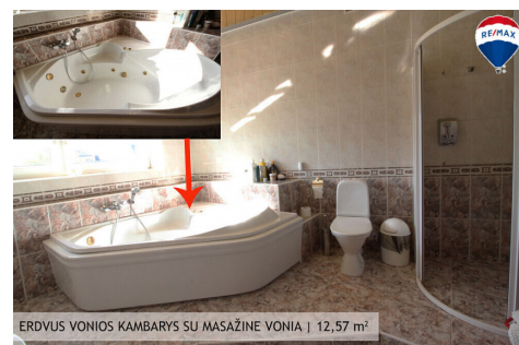
ERDVUS VONIOS KAMBARYS SU MASAŽINE VONIA | 12,57 m 2