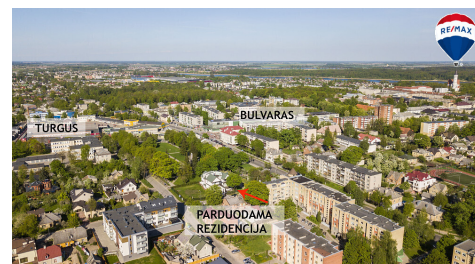
TURGUS BULVARAS PARDUODAMA REZIDENCJA