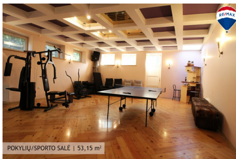
POKYLIŲ/SPORTO SALĖ | 53,15 m 2