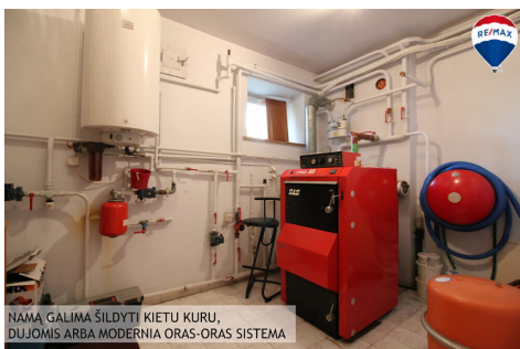
NAMŲ GALIMA ŠILDYTI KIETU KURU, DUJOMIS ARBA MODERNA ORAS-ORAS SISTEMA