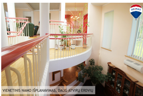
VIENITINIS NAMO ĮSIPLANAVIMAS, DAUG ATVIRŲ ERDVIŲ