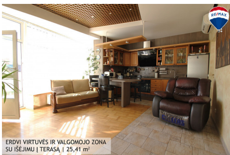
ERDVI VIRTUVĖS IR VALGOMOJO ZONA SU IŠĖJIMU Į TERASĄ | 25,41 m 2