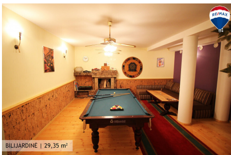
BILIJARDINĖ | 29,35 m 2