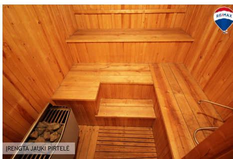
ĮRENGTA JAUKI PIRTELĖ