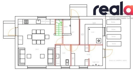
1. AUKŠTĀS PLĀNS 60,98 M 2