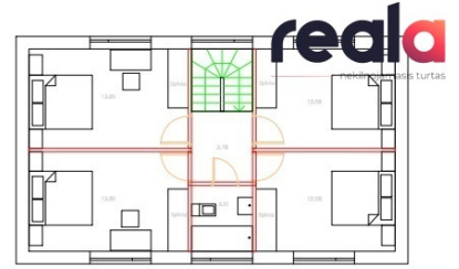
2. AUKŠTĀS PLĀNS 59,15 M 2