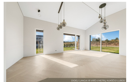
DIDELI LANCAI IR VIRŠ 4 METRŲ AUKŠČIO LUBOS