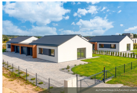
AUTOMATINIAI ĮVAŽIVIMO VARTAI