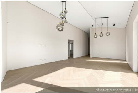
AŽUOLO MASIVO PARKETLENTE