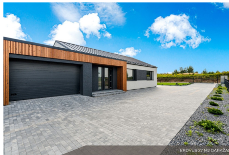
ERDVUS 27 M2 GARAŽAS