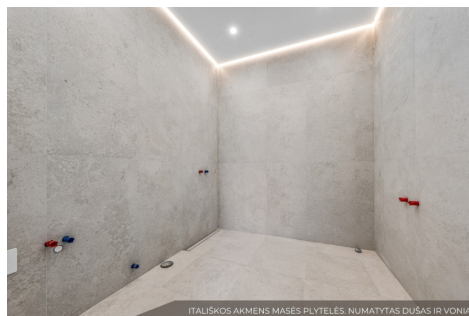
ITALISKOS AKMENS MASĖS PLYTELĖS, NUMATYTAS DŪŠAS IR VONIA