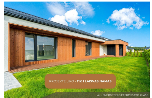
PROJEKTE LIKO - TIK 1 LAISVAS NAMAS