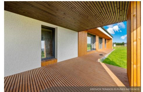
ERDVIOS TERASOS IŠ PUŠIES MEDIENOS