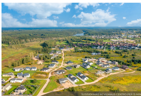
SUSISIEKIMAS KI VILNIAUS CENTRO PER 15 MIN