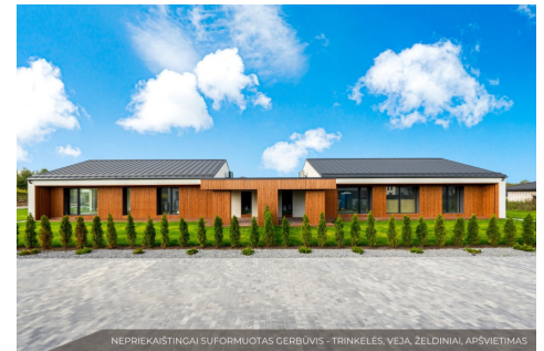
NEPRIEKAIŠTINGAI SUFORMUOTAS GERBŪVIS - TRINKELĖS, VEJA, ŽELDINIAI, APSVIETIMAS