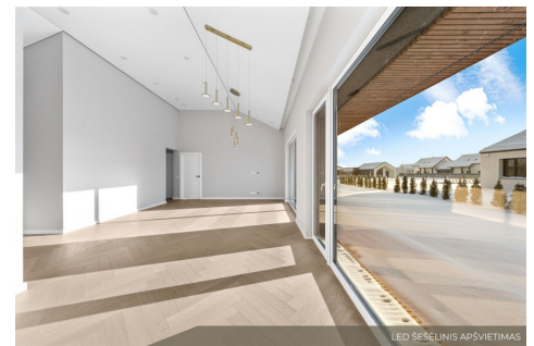
LED SĖSELINIS APŠVIETIMAS