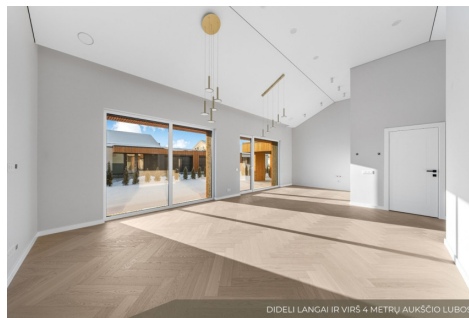
DIDELI LANCAI IR VIRŠ 4 METRŲ AUKŠČIO LUBOS