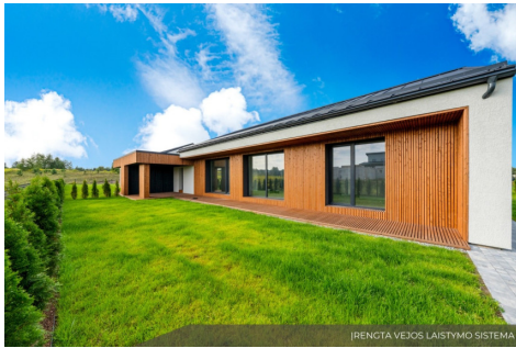
IRENGTA VEIVOS LAISTYMO SISTEMA