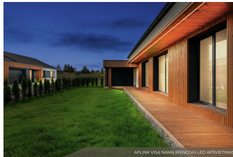
APLINK VISA NAMŲ IRENGTAS LED APŠVIETIMAS