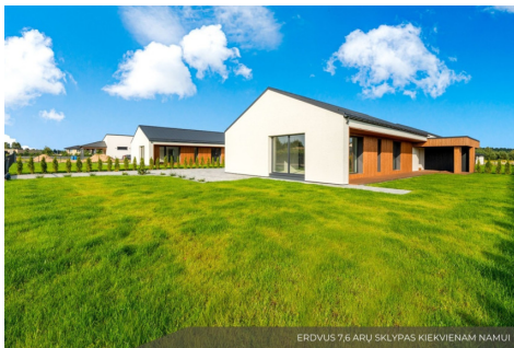
ERDVUS 7,6 ARŲ SKLYPAS KIEKVIenam NAMUI