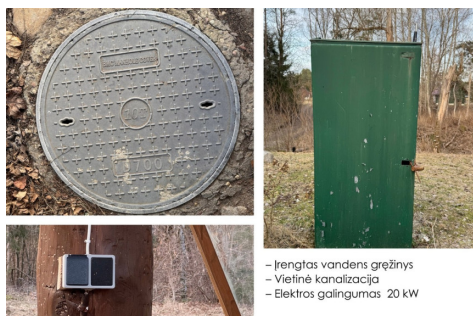
- Įrengtas vandens grežinys - Vietinė kanalizacija - Elektros galiosumas 20 kW