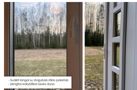
- Sudėti langai su dvigubais stiklo paketais - Įrengtos kokybiškos lauko durys