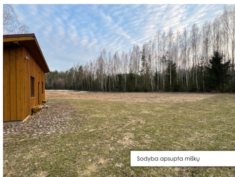
Sodyba apsupta miškų