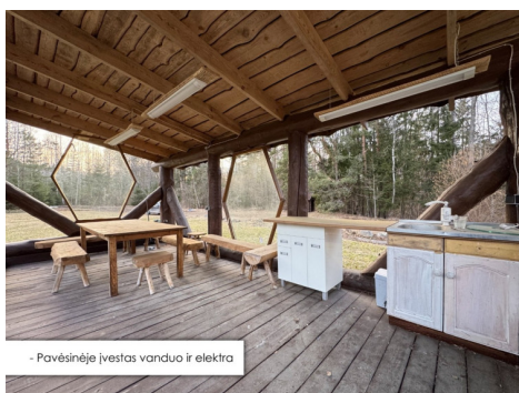
- Pavėsinėje įvestas vanduo ir elektra