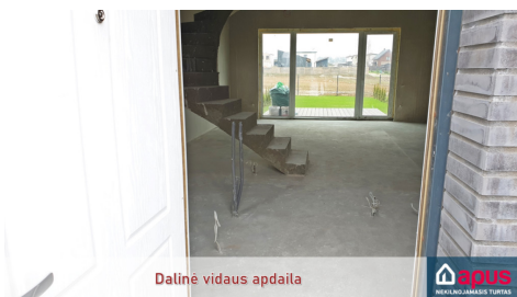
Dalinė vidaus apdaila