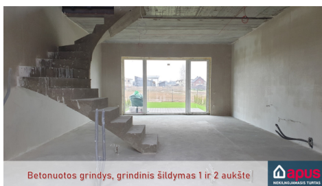
Betonuotos grindys, grindinis šildymas 1 ir 2 aukšte