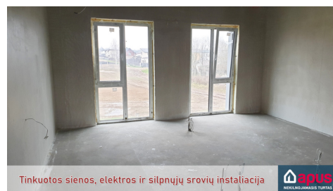
Tinkuotos sienos, elektros ir šilpnųjų srovių instaliacija