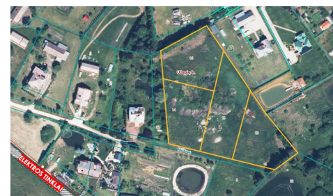
ŽEMĖS SKLYPO PLANAS Bendras plotas: 82,85 a