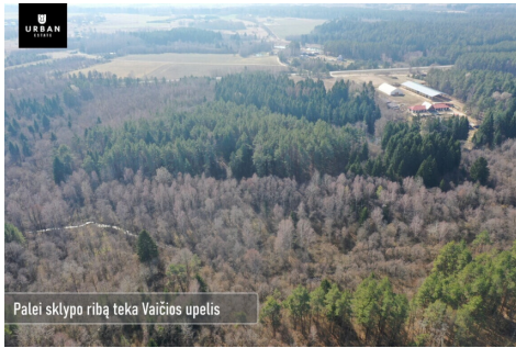
Palei sklypo ribą teka Vaičiūs upelis