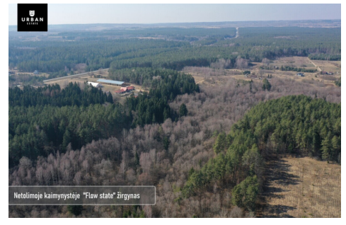
Netolimoje kaimynystėje "Flow state" žirgynas