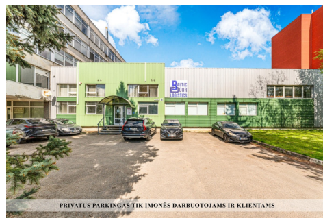
PRIVATUS PARKINGAS TIK ĮMONĖS DARBUOTOJAMS IR KLIENTAMS