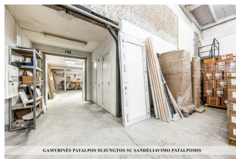
GAMYBINĖS PATALPOS SUJUNGTOS SU SANDELIAVIMO PATALPOMIS