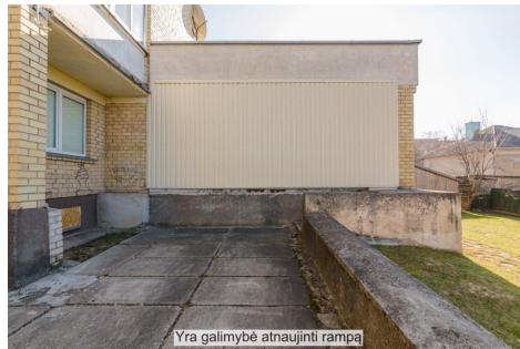
Yra galimybė atnaujinti rampą