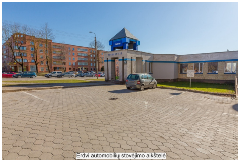
Erdvi automobilių stovėjimo aikštelė