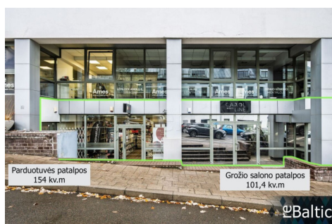
Parduotuvės patalpos 154 kv.m