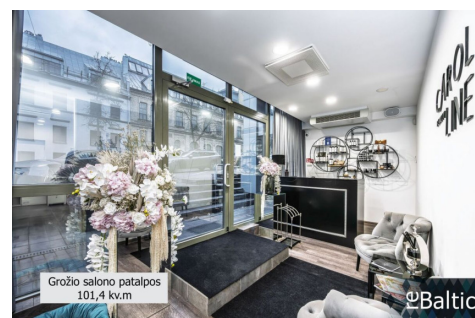
Grožio salono patalpos 101,4 kv.m