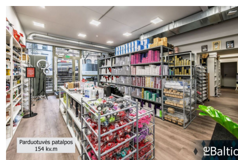
Parduotuvės patalpos 154 kv.m