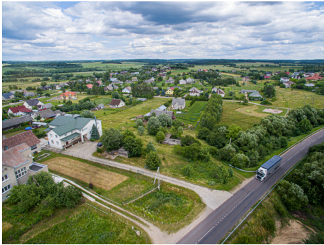
1 a. planas