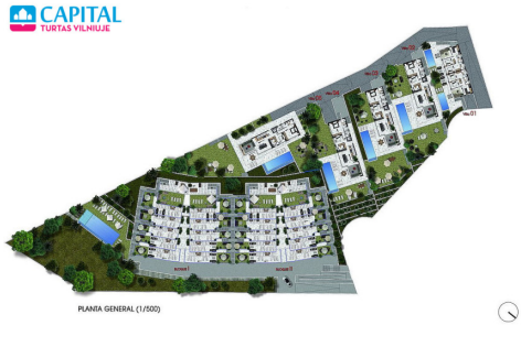
PLANA GENERAL (1/2000)