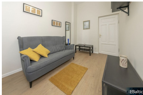
Galimybė palikti sofa arba pastatyti lovą ar sofa-lovą, atsižvelgiant į Jūsų poreikius Possibility to leave a sofa or to place a bed or a sofa-bed, depending on your needs