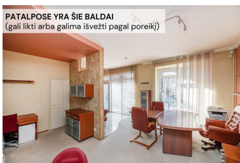
PATALPOSE YRA ŠIE BALDAI (gali likti arba galima išvežti pagal poreikį)