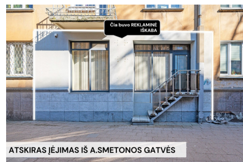
ATSKIRAS JĖJIMAS IŠ A.SMETONOS GATVĖS