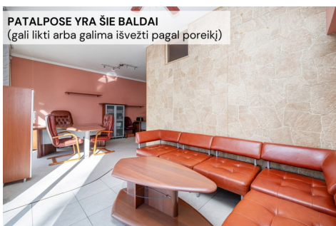
PATALPOSE YRA ŠIE BALDAI (gali likti arba galima išvežti pagal poreikį)