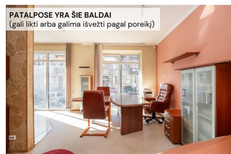
PATALPOSE YRA ŠIE BALDAI (gali likti arba galima išvežti pagal poreikį)