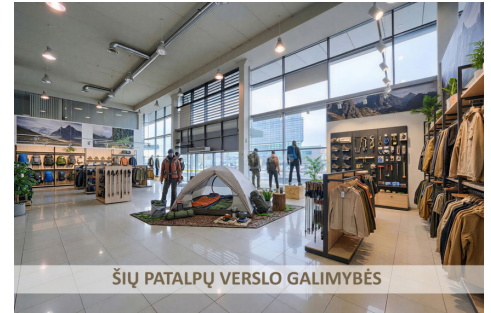
ŠIŲ PATALPŲ VERSLO GALIMYBĖS