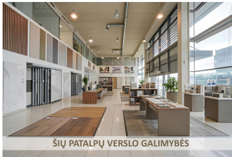
ŠIŲ PATALPŲ VERSLO GALIMYBĖS