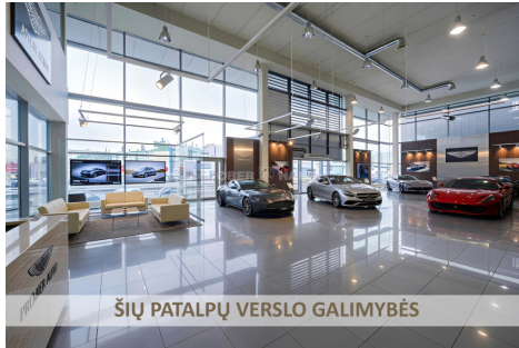
ŠIŲ PATALPŲ VERSLO GALIMYBĖS