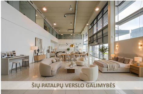
ŠIŲ PATALPŲ VERSLO GALIMYBĖS