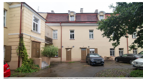
Nemokama parkavimo vieta vidiniame kieme