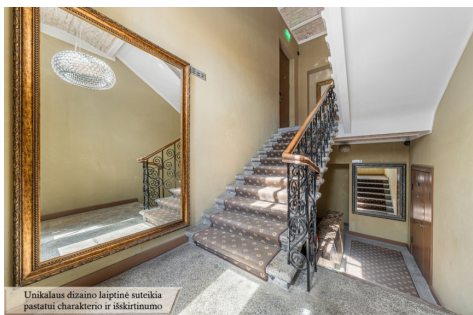
Unikalus dizaino laiptinė suteikia pastatui charakterio ir išskirtinumo