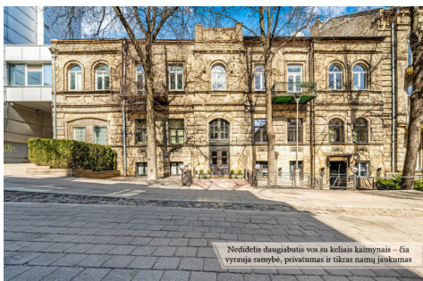
Nedidelis daugiabutis vos su keliais kaimynais – čia vyrauja ramybė, privatumas ir tikras namų jaukumas