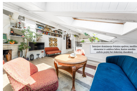
Interjere dominuoja šviesos spalvos, medžio elementai ir aukštos lubos, kurios suteikia erdvės pojūtį bei šilkinį charakterį