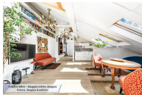
Aukštos lubos – daugiau erdvės, daugiau šviesos, daugiau komforto