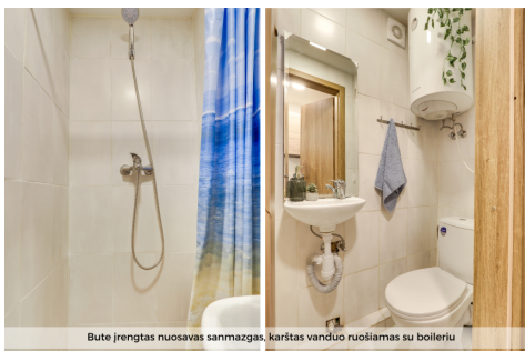
Bute įrengtas nuosavas sanmazgas, karštas vanduo ruošiamas su boileriu