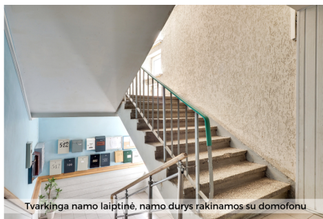
Tvarkinga namo laiptinė, namo durys rakinamos su domofonu