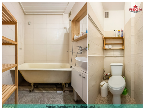
Vonios kambarys ir tualetas atskirai.