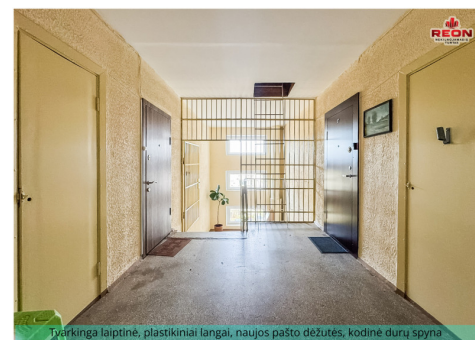
Tvarkinga laiptinė, plastikiniai langai, naujos paštos dėžutės, kodinė durų spyna