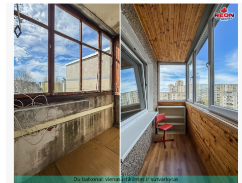
Du balkonai: vienas ištinkintas ir sutvarkytas