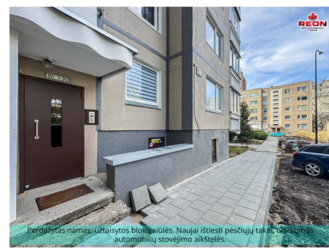
Perdažytas namas, užtaisytos blokšlaitės. Naujai ištiesyti pėsčiųjų takai, tvarkingas automobilių stovėjimo aikštelės.