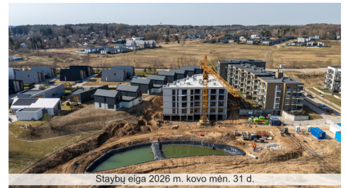
Statybų eiga 2026 m. kovo mėn. 31 d.