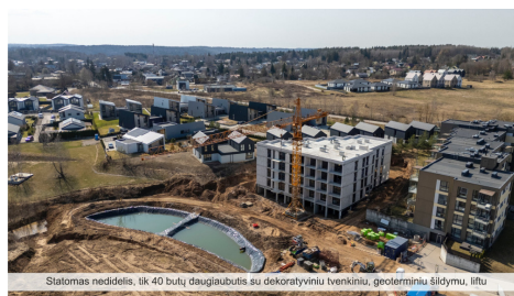
Statomas nedidelis, tik 40 butų daugiabutis su dekoratyviniu tvenkiniu, geoterminiu šildymu, lifu