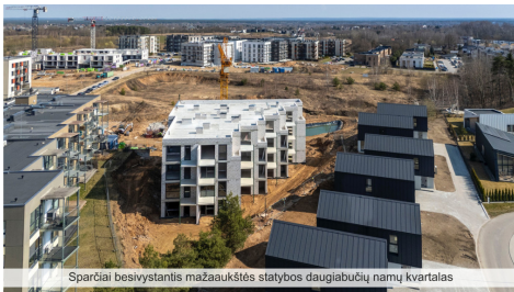
Spartiai besivystantis mažaaukštės statybos daugiabučių namų kvartalas

Telefono numeris: +370 67030815 Susisiekti el.paštu: inga.antanaitiene@capitalreality.com