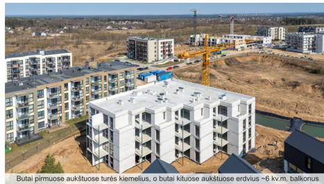
Butai pirmuose aukštuose turės kiemelius, o butai kituose aukštuose erdvius ~6 kv.m. balkonius