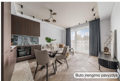
Buto įrengimo pavyzdys

Telefono numeris: +370 67030815 Susisiekti el.paštu: inga.antanaitiene@capitalrealty.com