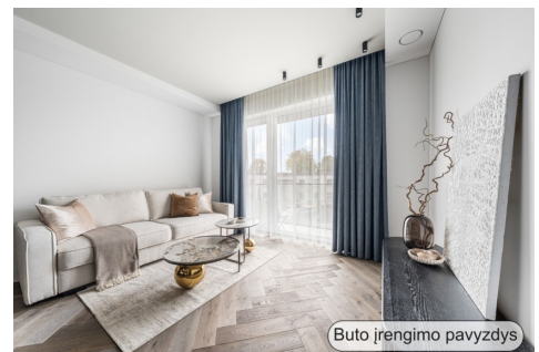
Buto įrengimo pavyzdys