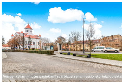
Vos per kelias minutes pasiekiami svarbiausi senamiesčio istoriniai objektai