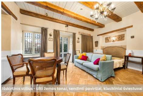
Išskirtinis stilius - šilti žemės tonai, sendinti paviršiai, klasikiniai šviestuvai