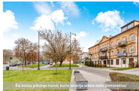
Šis butas įsikūręs name, kurio istorija siekia kelis šimtmečius