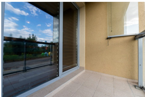
2 KAMBARIŲ BUTO PLOTAS 51,83 M 2