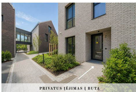
PRIVATUS IĒJĪMAS Ī BUTA