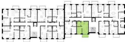
4 AUKŠTO PLANAS