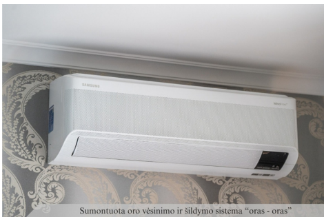
Sumontuota oro vėsinimo ir šildymo sistema "oras - oras"