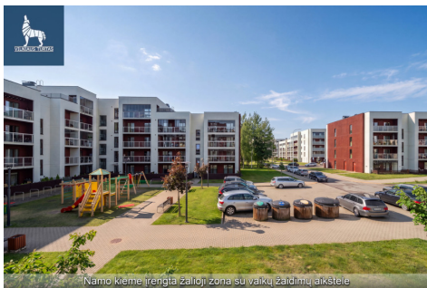
Namo kieme (rengta žalią) zona su vaikų žaidimų aikšte