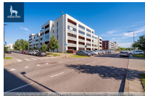
Apimk namo teritoriją daug bendrojo naudojimo automobilių parkavimo vietų