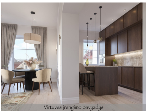
Virtuvės įrengimo pavyzdys