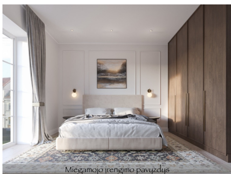
Miegamojo įrengimo pavyzdys