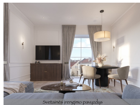
Svetainės įrengimo pavyzdys