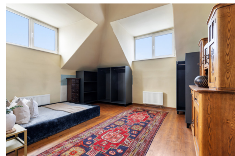
5 KAMBARIŲ BUTO PATALPŲ EKSPLIKACIJA BENDRAS PLOTAS – 204,12 m 2