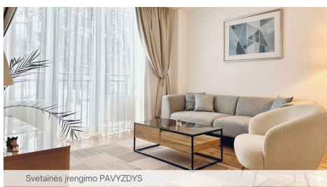
Svetainės įrengimo PAVYZDYS