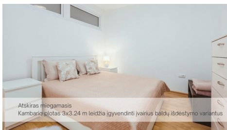
Atskiras miegamasis Kambario plotas 3x3,24 m leidžia įgyvendinti įvairius baldų išdėstymo variantus