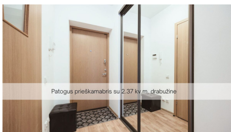
Patogus prieškambaris su 2,37 kv.m. drabužine