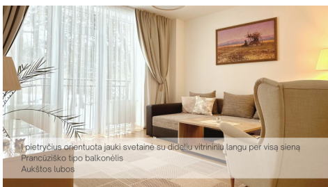
Į pietryčius orientuota jauki svetainė su dideliu vitrininiu langu per visą sieną Prancūziško tipo balkonėlis Aukštos lubos