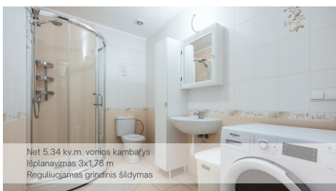
Net 5,34 kv.m. vonios kambarys Išplanavimas 3x1,78 m Reguliuojamas grindinis šildymas