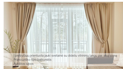
Į pietryčius orientuota jauki svetainė su dideliu vitrininiu langu per visą sieną Prancūziško tipo balkonėlis Aukštos lubos