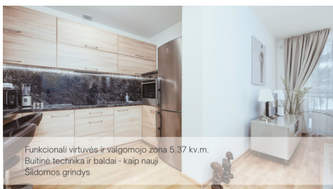
Funkcionali virtuvės ir valgomąjo zona 5,37 kv.m. Būtinė technika ir baldai - kaip nauji Šildomos grindys