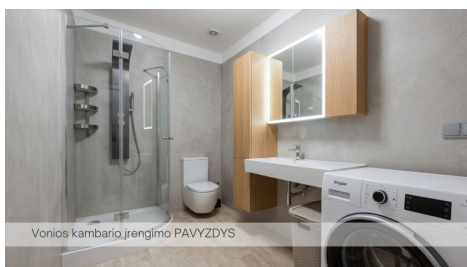
Vonios kambario įrengimo PAVYZDYS