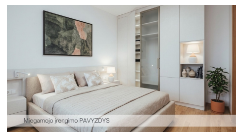
Miegamojo įrengimo PAVYZDYS