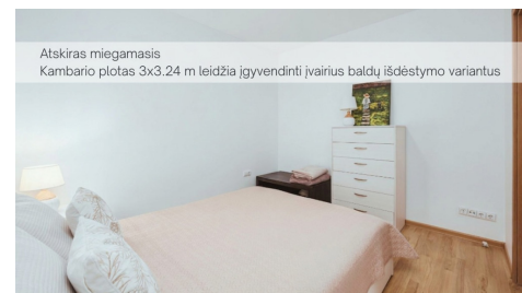
Atskiras miegamasis Kambario plotas 3x3,24 m leidžia įgyvendinti įvairius baldų išdėstymo variantus