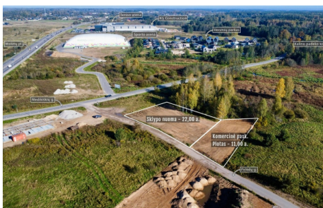
Perleidamas objektas: 11,00 arų plotas komercinės paskirties sklypas (su galimybe išstatyti komercinį pastatymą) 20 arų sklypas / Adresas: Priešų g. 6, Didieji Gulbinai