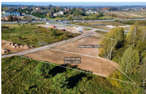
Perleidamas objektas: 11,00 arų plotas komercinės paskirties sklypas (su galimybe išstatyti komercinį pastatymą) 20 arų sklypas / Adresas: Priešų g. 6, Didieji Gulbinai