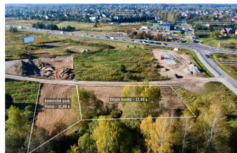
Perleidamas objektas: 11,00 arų plotas komercinės paskirties sklypas (su galimybe išstatyti komercinį pastatymą) 20 arų sklypas / Adresas: Priešų g. 6, Didieji Gulbinai