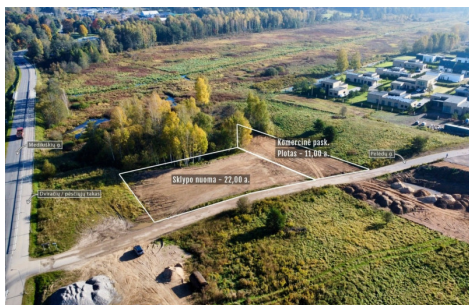
Perleidamas objektas: 11,00 arų plotas komercinės paskirties sklypas (su galimybe išstatyti komercinį pastatymą) 20 arų sklypas / Adresas: Priešų g. 6, Didieji Gulbinai