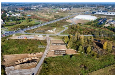
Perleidamas objektas: 11,00 arų plotas komercinės paskirties sklypas (su galimybe išstatyti komercinį pastatymą) 20 arų sklypas / Adresas: Priešų g. 6, Didieji Gulbinai