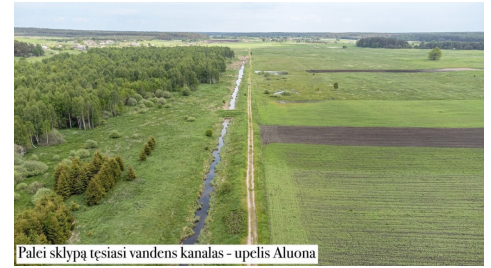
Palci sklypą tęsiasi vandens kanalas – upelis Aluoma