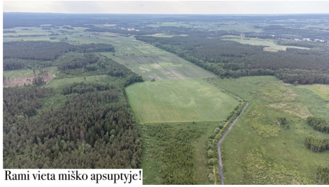
Rami vieta miško apsuptyje!