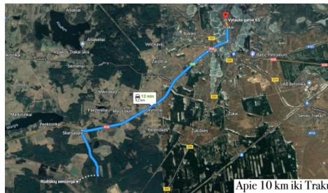
Apie 10 km iki Trakų