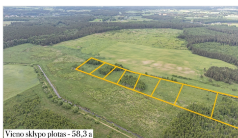
Vieno sklypo plotas - 58,3 a