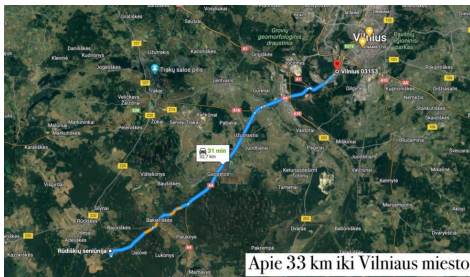
Apie 33 km iki Vilniaus miesto