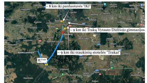
~ 8 km iki parduotuvės "TKI"