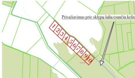
Privažiavimas prie sklypų šalia csančių keliu