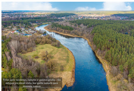
Tylus upės vandens, ramybės ir gamtos grožis – šis sklypas yra ideali vieta, kur galite sukurti savo svajonių namus