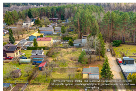
Sklypas su vaizdu į mišką – kur kasdienybė tampa poilsu. Mūsų kitoje žaliuojančioje aplinkoje, paukščių čiužėjimui ir gamtos kvapams tiesiai už savo namų durų