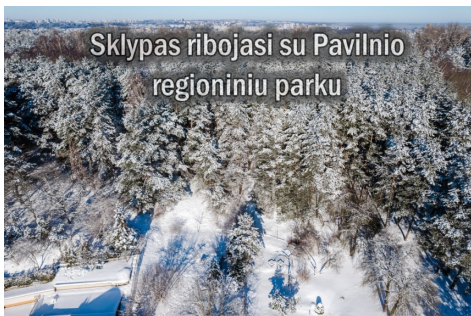
Sklypas ribojasi su Pavilnio regioniniu parku