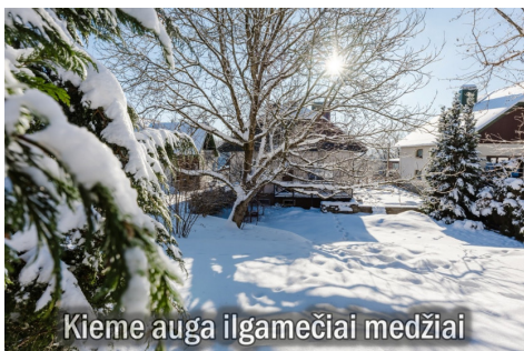
Kieme auga ilgamečiai medžiai