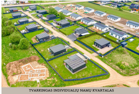
TVARKINGAS INDIVIDUALIŲ NAMŲ KVARTALAS