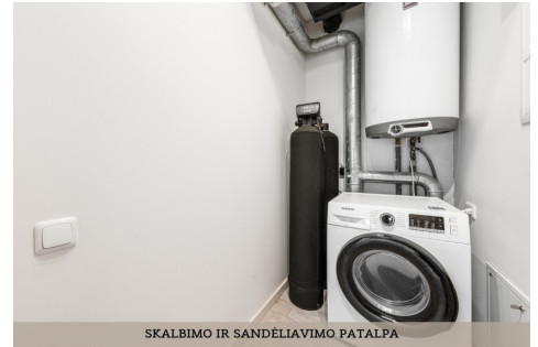
SKALBIMO IR SANDĖLIAVIMO PATALPA