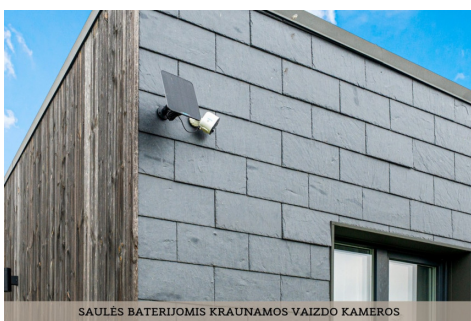
SAULĖS BATERIJOMIS KRAUNAMOS VAIZDO KAMEROS