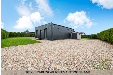
ERDVUS PARKINGAS BENT 5 AUTOMOBILIAMS