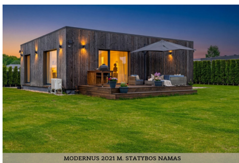
MODERNUS 2021 M. STATYBOS NAMAS