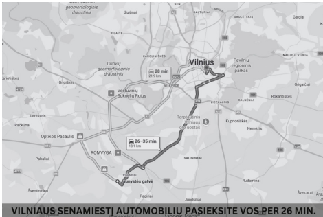
VILNIAUS SENAMIESTĮ AUTOMOBILIŲ PAŠIEKITE VOS PER 26 MIN.