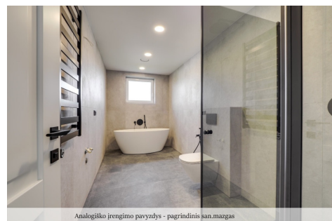
Analogiško įrengimo pavyzdys - pagrindinis san.mazgas