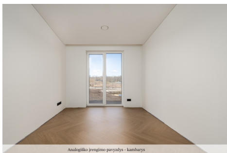
Analogiško įrengimo pavyzdys - kambarys