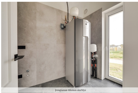
Įrengiamas šilumos siurblys