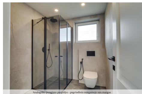
Analogiško įrengimo pavyzdys - pagrindinio miegamojo san.mazgas