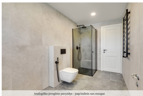
Analogiško įrengimo pavyzdys - pagrindinis san.mazgas