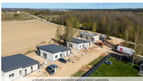
4 viėmėdės architektūros individualūs namai su miesto vandentiekėiu