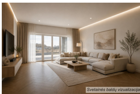
Svetainės baldų vizualizacija

Susisiekti el.paštu: martynas.narkauskas@capitalrealty.com