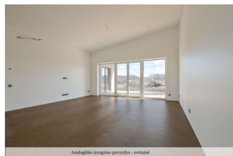
Analogiško įrengimo pavyzdys - svetainė