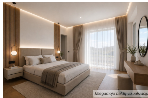
Miegamojo baldų vizualizacija