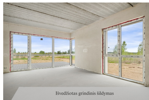
Išvedžiotas grindinis šildymas