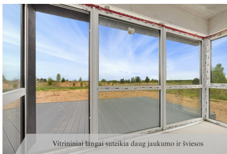
Vitriniai langai suteikia daug jaukumo ir šviesos