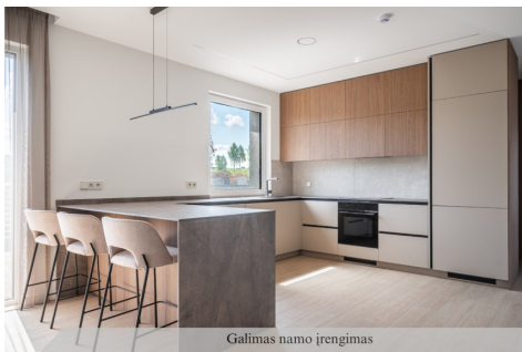
Galimas namo įrengimas