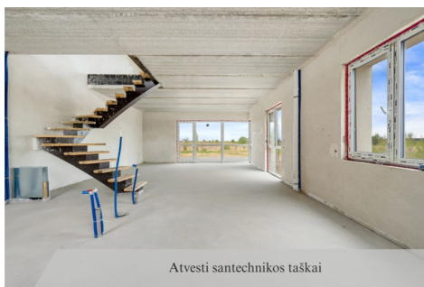
Atvesti santchnikos taškai