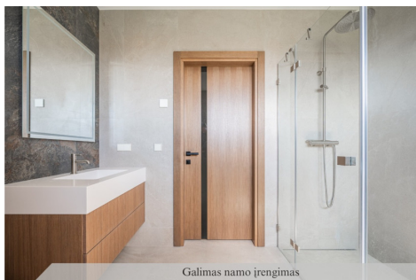
Galimas namo įrengimas