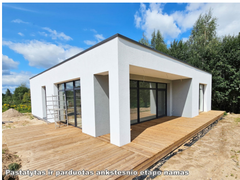
Pastatytas ir parduotas ankstesnio etapo namas

Telefono numeris: +370 609 98 655 Susisiekti el.paštu: vidmantas@apus.lt